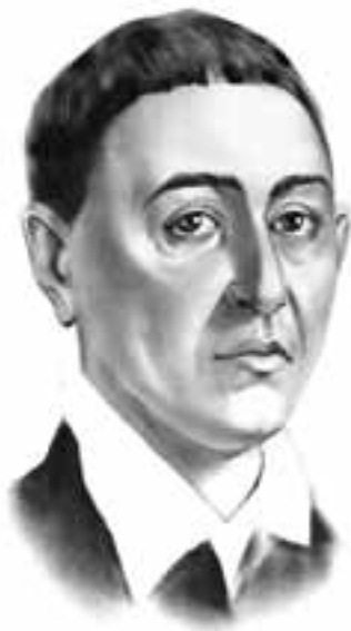
■ Григорій Савич Сковорода (1722–1794) — український просвітитель-гуманіст, філософ, поет, педагог